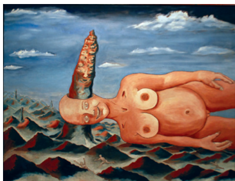
Galerie Provázek David Cajthaml – malba 21. září - 29. října 2013

ník, hudebník... podivnými okolnostmi mi prochází rukama mnoho vášní. dávám tvar a zvuk věcem které jsou (pro nás, proklatce z okraje) životadárné. kroků v životě moc nenaděláme, špička kdysi krásné botky je přišlápnutá koťátkem, nohavice ztěžklé dehtem z cigaretového dýmu, často není vidět na krok, tak se láska hledá jen hmatem. mezi sebevraždou a tvořením je prý velice tenká hranice, prý...“