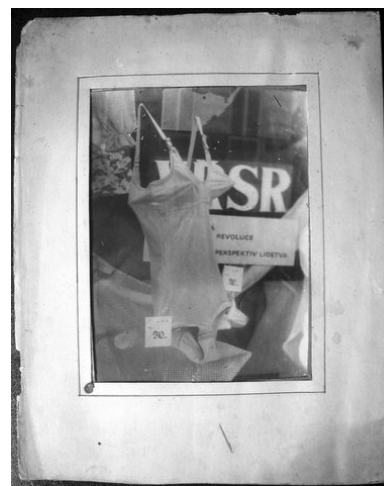
Miroslav Tichý – Revoluce perspektiv lidstva