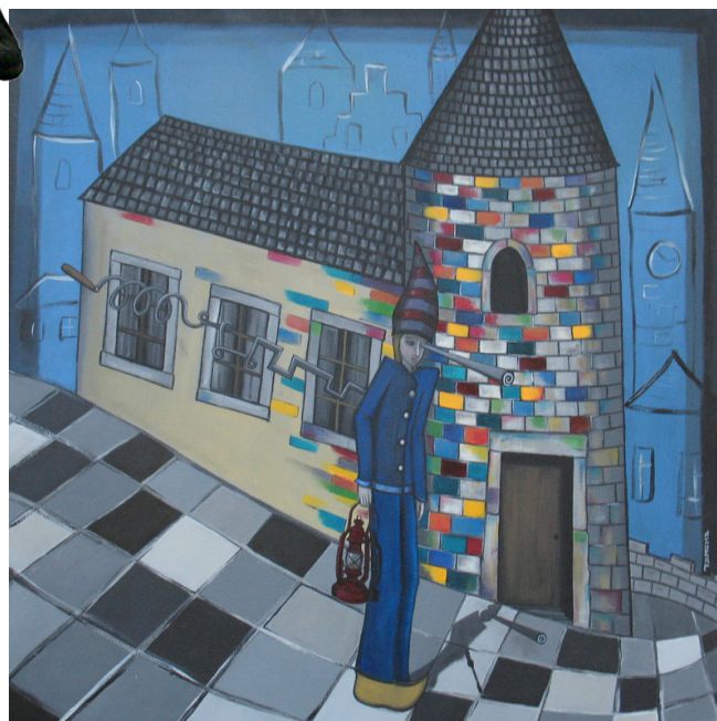
Vpravo: Brian Tjepkema – Mystik pravá ruka boha , 2011