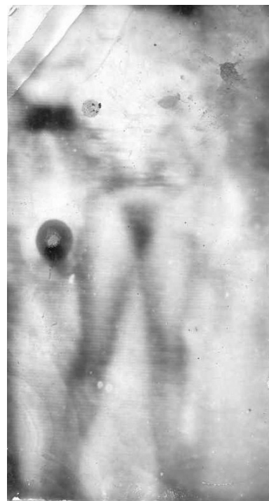
Miroslav Tichý – fotografie

„Těmito výstavami ukážu českému publiku podrobný plán mého vynálezu „Stroj na sny“, nyní dělám reálné umění a spolupracuji s ostatními lidmi, časem chci používat celou Českou republiku, jako moje plátno. Takto mohu udělat z Česka největší kolotoč v celé Evropě.“