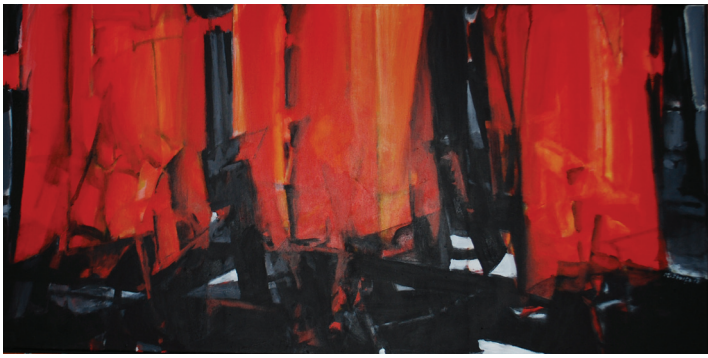
Miroslav Štolfa – Ohnivá znamení, 2013, akryl

Zájem o svět technologizované západní civilizace přivedl tvorbu Miroslava Štolfy až k podstatným otázkám po lidském údělu daleko přesahujícím prosté konstatování vztahu člověka, stroje a techniky vůbec. Svou výsostně malířskou a kreslířskou tvorbou tak již dávno přestoupil rámec