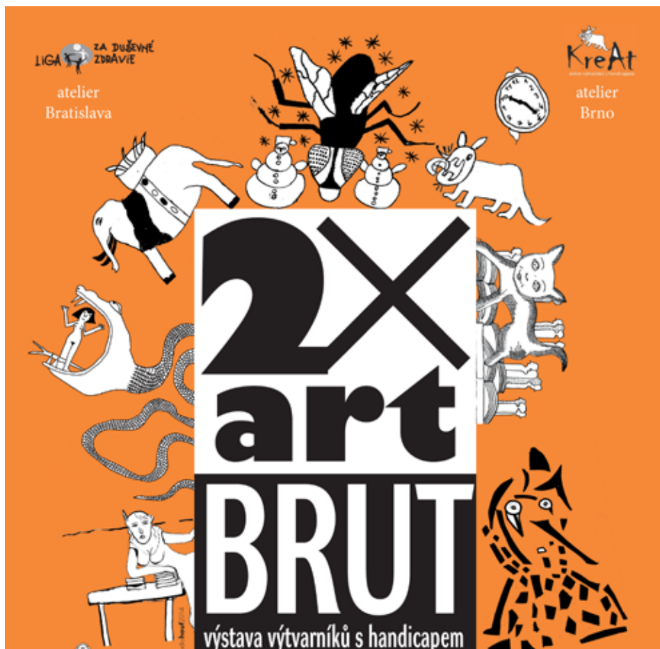
Výstava soudobého ARTBRUT v prostorách Galerie Katakomby (více na straně 3)

Katedra Vv, PdF MU, Poříčí 7 www.tvk-brno.cz