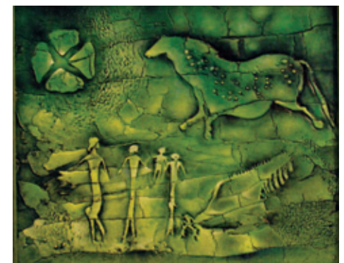
Galerie Katakomy Jaroslav Sklenář – Jeskynní malby 5. listopadu – 28. listopadu 2014