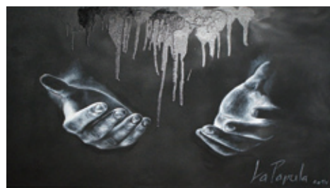
Salon Galapa La Papula – Obrazy 24. září 2014 – 15. ledna 2015