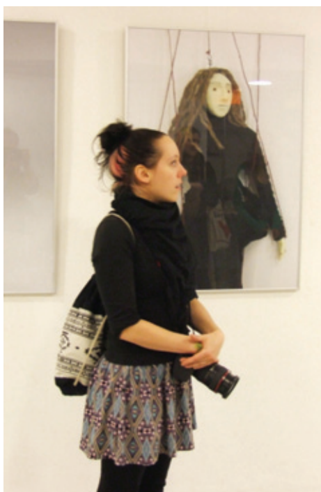
V HaDivadle vystavují studenti oboru Nová média SUŠ v Brně (více na str. 9)