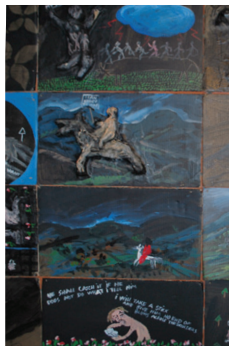
Radikální divadlo včera a dnes, Galerie Provázek (více na str. 2)